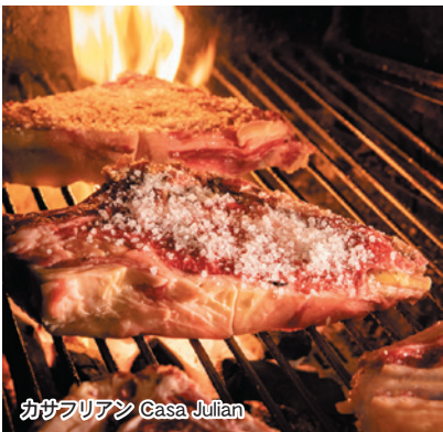
カザフリエン Casa Julian