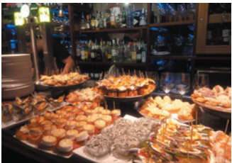
サンセバスチャン & ビルバオ