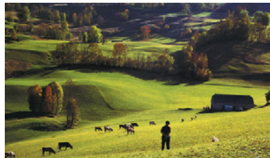
フランスバスク風景